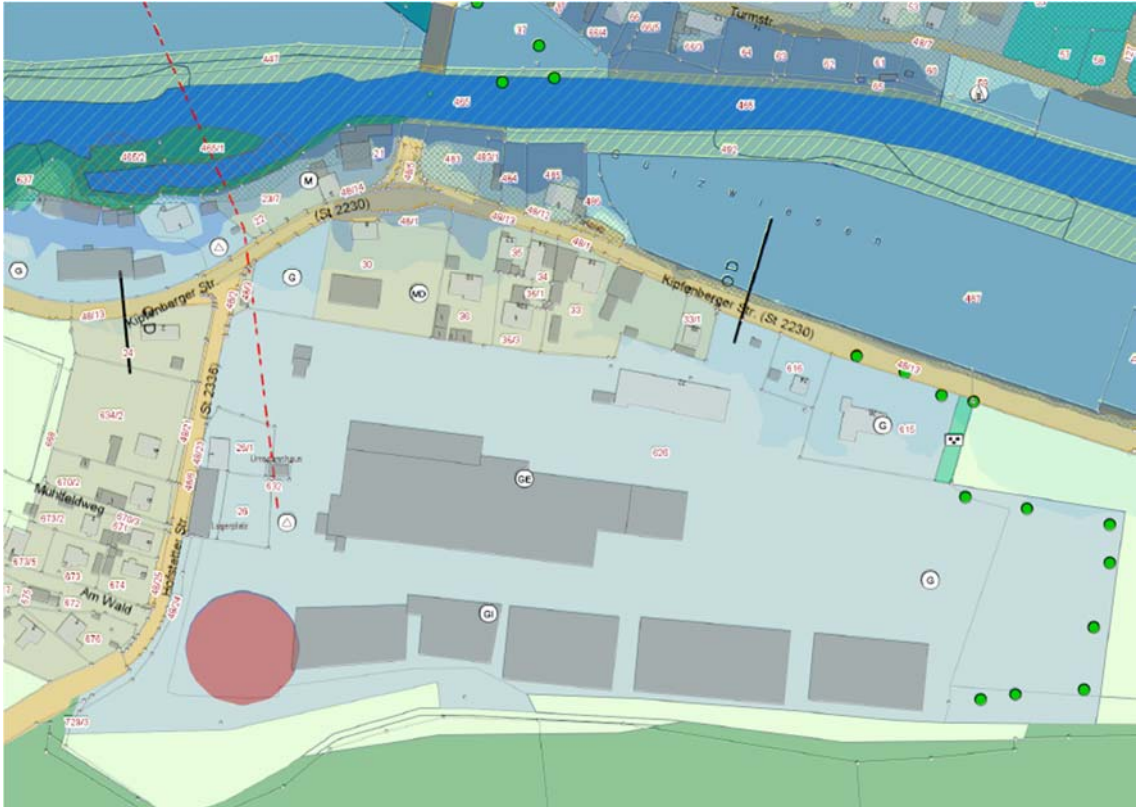
FNP nach der 8. Änderung