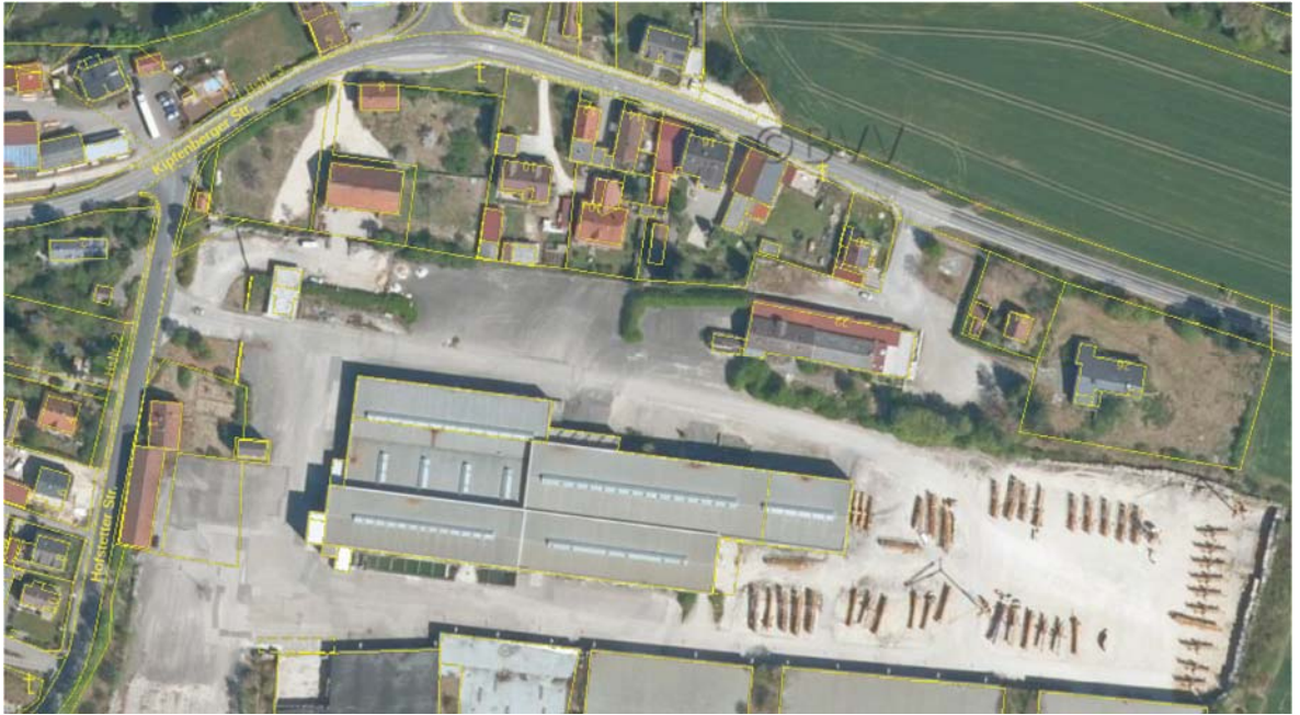
Luftbild der Flächenbereiche die geändert werden sollen