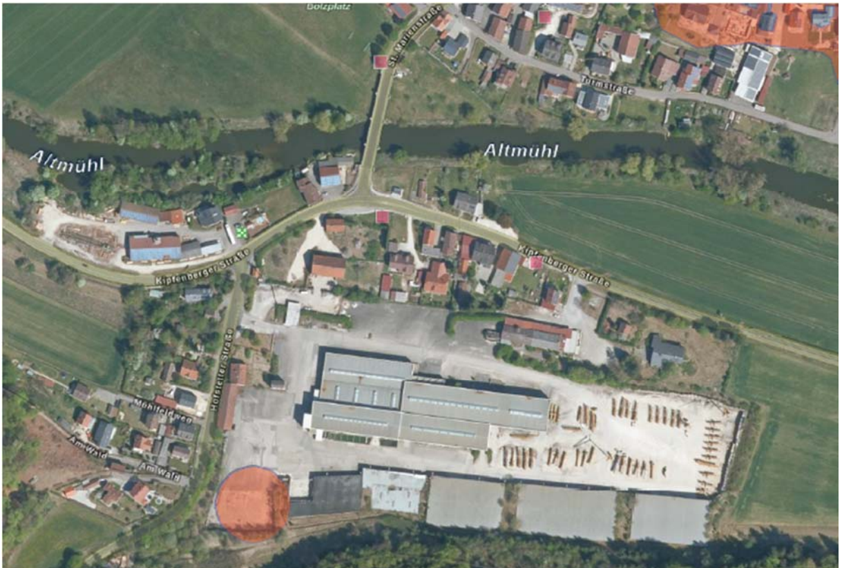
Bodendenkmäler in Gungolding

Unter Kultur- und sonstigen Sachgütern sind Güter zu verstehen, die Objekte von gesellschaftlicher Bedeutung als architektonisch wertvolle Bauten oder archäologische Schätze darstellen und deren Nutzbarkeit durch die Vorhaben eingeschränkt werden könnten.